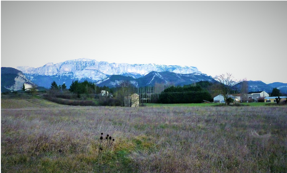
Le terrain que la Communauté de Communes souhaite bétonner pour l'extension de la Zone d'Activités

Aujourd'hui, encore plus dans la période que nous traversons - Covid, guerre en Ukraine - se pose la question de l' AUTONOMIE ALIMENTAIRE de notre territoire. Nous ne pouvons plus être à la merci d'une crise !